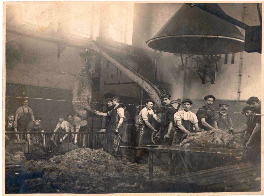
Korabeli sertésvágóvonal