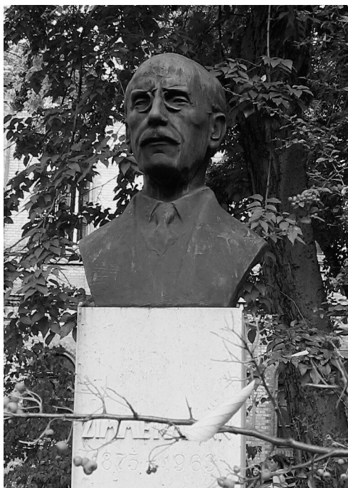
ZIMMERMANN ÁGOSTON SZOBRA AZ EGYETEM PARKJÁBAN (MADARASSY WALTER ALKOTÁSA)

Tudományos munkáinak száma – könyvein kívül – több százra tehető. Azok nagyobbára részletkérdések megoldását foglalják magukban. Munkáit az öntudatos látás élessége és gyorsasága, a reprodukálókészség hűsége és biztossága jellemzik. Tartalmi értékein felül rá kell mutatni azok mintaszerű szerkezetére, a tudományos leírások világosságára, tudományos nyelvének tisztaságára.