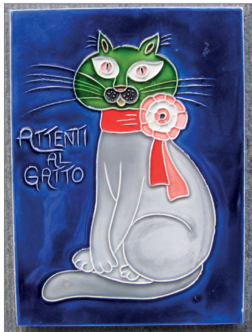
Állatorvosi cégér Brüsszelből

zió és a modernitás harmonikusan jelennek meg egymás mellett, ahogyan a sokféle ember is békében élvezzi a parkokat a nyári ludak és a törpenyulak, valamint a sörözőket egymás társaságában.