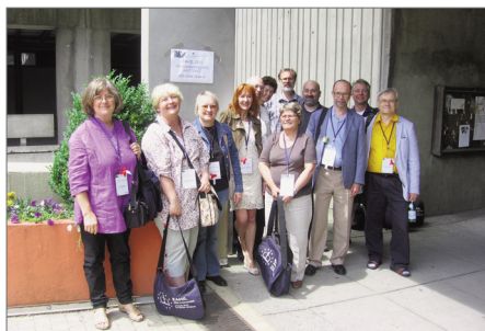
Az EVLG tagjai a konferencián

Az állatorvos-tudomány érzékenyebb terület, mint az orvosi könyvtárosoké, mert az egykor önálló állatorvosi könyvtárakat nagyobb részben integrálták más (általában mezőgazdasági vagy nagy egyetemi) könyvtárakkal, így az állatorvosi irodalom is beolvadt, és elenyésző részét képezi egy-egy nagy gyűjteménynek. Egyre kevesebb szakember működik ezen a speciális területen, az „állatorvosi könyvtáros” kihalóban van. Az EAHIL keretében működő EVLG (European Veterinary Libraries Group), amelynek könyvtárunk alakulása óta a tagja, az európai állatorvosi könyvtárosokat lazán összefűző szervezet, amelynek megújulásra van szüksége. Az idősödő tagság a fiatalok aktívabb részvételét a közösségi hálózat használatától reméli, amelyen talán megfogalmazódik vagy újrafogalmazódik az állatorvosi könyvtáros szerepköre a maga sajátosságaival, amelyek követik az állatorvosi szakma sajátosságait.