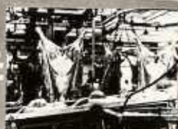
FÜGDESZTEK BŐRFEJTÉSÉNél A BŐR NEM SZENNYEZŐDIK