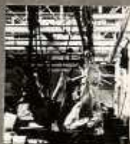
BEVÁGÁS ELŐTT A HÚSBARATI TÁRSASÁG