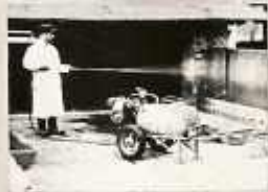
ENNEK HIÁNYÁBAN HÁTIPLERMETEZŐVEL FERTŐTLENÍTJÜK