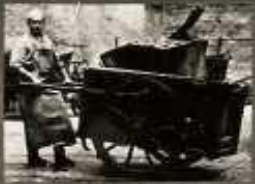
A SZÜKSÉHEZ KÉPES NAPILÁBAN TÖBBMŐRÖZT MOSSUK LE