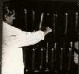
ÉS A KÉSZTERMÉKBŐL IS MINTÁT VESZ.