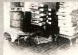
A HÚSZÁLLÍTÓ LÁDAK KEZELÉSE IS FOKMÉRŐJE AZ ÜZEMI HYGIÉNÉNEK.