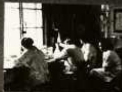
ELBÍRÁJÁK A KÉSZÍTMÉNY BAK- TERIOLÓGIAI VIZSGÁLATÁNAK EREDMÉNYÉT

LÁDAMOSÁS FELHA- NYAGOLÁSÁNÁL A HÚS PÉP IS SZENNYEZŐDIK BAKTÉRIUMOKKAL, AMELYEK A VIZSGÁLAT SORÁN A TÁPANYAGOK GÁZJÁRULMÁNÁBÓL TERMEKNEK.