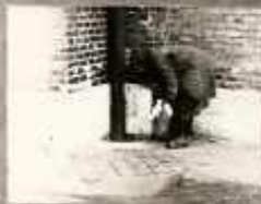
HA A PATKÁNYTÁRRA FELTÉRKESSÜNK