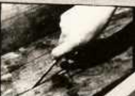
A FALÁNÁK RÉSZÉBŐL VETT KAPARÉK A KÜLÖN FÉLE ROJMASZTÓ (STAPHYLOCOCCUS) BAKTÉRIUMOK MELLETT MÁS BAKTÉRIUMOKAT IS MEGTALÁLHATUNK.