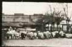
KEZELÉS, HELYI TERELÉS A SZARVOSHEVÉREKRE