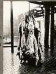
A FÖLDRE EJTETT HÚS NAGYMÉRTÉKŰEN SZENY- NYEZŐDIK A KÖVETKEZŐ ÉLŐ BAKTÉRIUMOKNAK