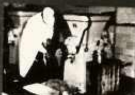
A GYÁRTÁS NYERSANYAGÁBÓL