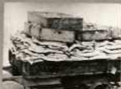
MERT A FALADÁK FENÉK RENDSZERINT SZENNYEZETT.