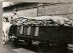
HELYTLEN SZÁLLÍTÁS: MERT AZ ÁRÚT NEM FEDI TELJESÉN A LEPEL.