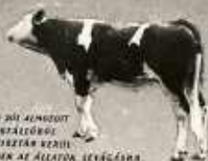
A JÓI ÁLLAMOT ISTÁLLÓTÓL TISZTÁN KEZELI MIND AZ ÁLLATOK LEVÁGÁSÁRA.