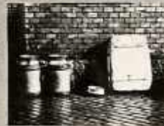
A KANNA FÉLBE A FÖLDÖN SPÓRAK BAKTERIUMOKKAL SZENNYEZŐDIK, RÖGZÍTÉSÜK AZT A KANNA FÉLBEZ.