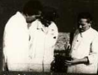
A MINŐSÉGI ELLENŐRZÉS SZORÁN ÉRZÉK- SZERVILEG MEGVIZSGÁJJA ÉS A LABORA- TÓRIUMBA KÜLDI.