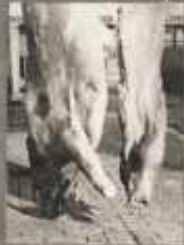
A TISZTAN KITERMELT HÚS A HÉLYTLEN SZÁLLÍTÁS KÖVET- KEZÉBEN SZENNYEZŐDIK