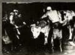
LEVÁGÁS ELŐTT MINDEK ÁLLATOT EL KELL KÁBITANI