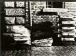
A SZARÁLY ALÓL NINCS HEVÉ KIVÉTELNEK