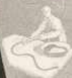
A LEVŐREDEZŐ FAKARADOK A HÚSPÉPPEL FÖLTÉLÉSKORRA KÉRŐLNEK