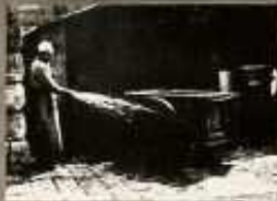
ÉS LEGALÁBB EGY SZER FERTŐTLENÍTŐK!