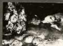
A NYELVET TÁRSASÁG FELDOLGÁSI TÁRSASÁG KÖZÖTT