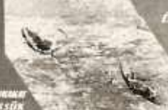
ÉS MÉRLEGEL SZÓRJUK KÖRÜL