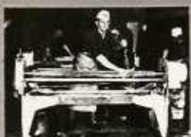
A SERTÉS ÁRBEVÉZŐGÉP RONKÁKAI ÉS A FEJINGÉZŐ ALKALMAZAT ALAPOSAN SÜRÖLJÜK LE.