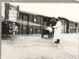
AZ ÁRSTRASZAKUDÓT KIVONÁS UTÁN LE KEZEL MÓDRA ÉS FERTŐTLENÍTENI