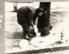
12. kép A higiénia személyi vonatkozásait illetően a kéz- és eszközfertőtlenítést részletesen ismerteti.