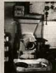
A GÉPENT RÖVID IDŐRE IS TISZTÁN HAGYJUK VISSZA.