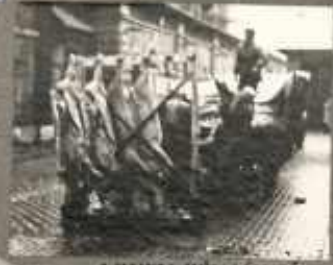
A HELYES HÚSZÁLLÍTÁS SZEM ELŐTT TARTJA A HYGIÉNE KÖVETEL- MÉNYEIT