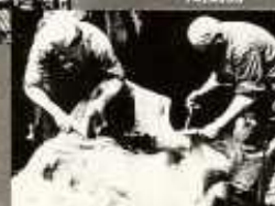
MINTE A SZARVOSHEVÉREK TÁRSASÁG