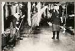
A VÁGÓÁLLÁSOK KÖVEZETÉT MINDEN FORRÁS UTÁN LE KEZEL MÓDRA ÉS A VÁGÁS BEFEJEZÉSE FERTŐTLENITENI