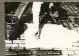
A VEDŐRÖZSÉNYT NE A SZERREZET KÖZVETLEN VEDÉSBŐL HANEM ÁSZTALON ÉS FOLYÓVÍZZEL MOSSUK LE

A MUNKA BEFEJEZÉSEKÉNT IS FERTŐZŐTLENÍTŐDÜNK