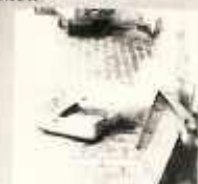
9. kép A hús útja a vágócsarnokból. Az üzemek közötti szállítást ábrázolja.