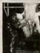
A JÓVÓ ÚTJA A FÜGDESZTEK ELVÉREZTETÉS ZÁRT EDÉNYBE