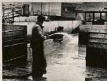
A KIÜRÍTÉSI AKCIÓKAT FELMOSSUK ÉS NAGYNYOMÁSÚ FERTŐTLENÍTŐ GÉPEL,