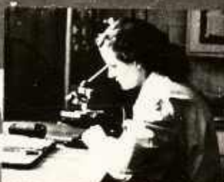
A SZABADSZEMVEL BIZTOSAN ELNEM BÍRÁLBÁTÓ KÖRÖMÖZMÉNYEK ENYÉ- VIZSGÁLATÁN EGÉSZSÉGRE ÁRTAL- MAS VOLTÁRÓK KÖRÖMÖZMÉNY- TANI VIZSGÁLATI DÖNTÉSEK.