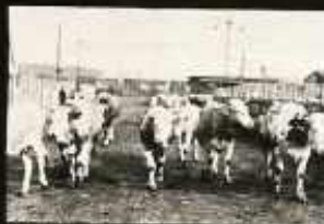
A PIHENTETŐI FOYAMATOSAN HÁRTJUK BE A MARRHÁT A VÁGÓCSARNOKBA!