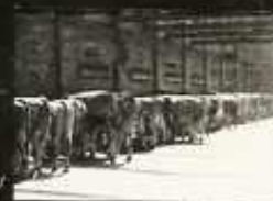
A VÁGÓÁLLATOKAT FEDETT HELYEN KELL TARTANI.