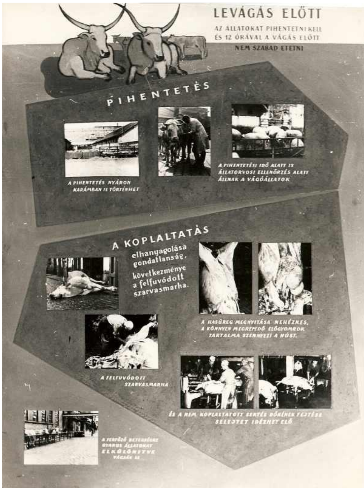
3. kép A levágás előtt a vágóállatok pihentetésének és koplaltatásának fontosságára mutat rá.