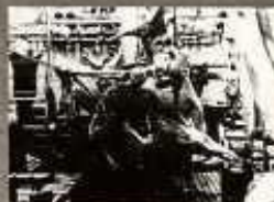
FÜGDESZTEK BŐRFEJTÉSÉNél A BŐR NEM SZENNYEZŐDIK