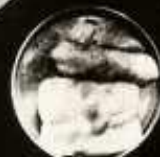
A LABORATÓRIUMI VIZSGÁLAT KÜLÖNBÖZŐ NYERSANYAGOK BAKTÉRI- OLÓGIAI ÉS KÖRÖMÖZMÉNY- TANI VIZSGÁLATI EREDMÉNYEINEK ALAPJÁN KÉSZÍTMÉNYEK MINŐSÉGÉT ELBÍRÁJÁK.