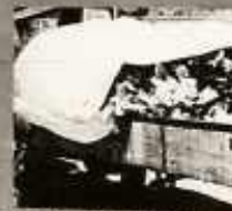
SZÁLLÍTÁS KÖZBEN FEHÉR LEPELLEK VÉDŐK A HÚST A RÁHULLÓ SZENY- NYEZŐDÉSTŐL