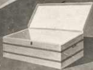
KISEBB HÚS- MENNYISÉG SZÁLLI- TÁSÁRA MEGFELELŐ A HÉZAGMENTESEN, FÉMPELL- NÉLKELT HÚSZÁLLÍTÓ LÁDA.