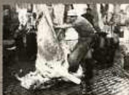
AZ ELVÉREZTETÉS A BŐRŐ TÁRSASÁG A HÚSBARATI