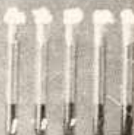
13. kép A húsvizsgálatot kiegészítő és a húskészítmények laboratóriumi vizsgálatáról nyújt tájékoztatást.