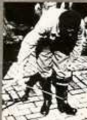
A LÁBBELI LE MOSÁSA UGYANÚGY NÉLKÜLÖZHETETLEN, MINT AZ ÁLAPUS KÉZMOSÁS ÉS FERTŐZŐTLENÍTÉS.