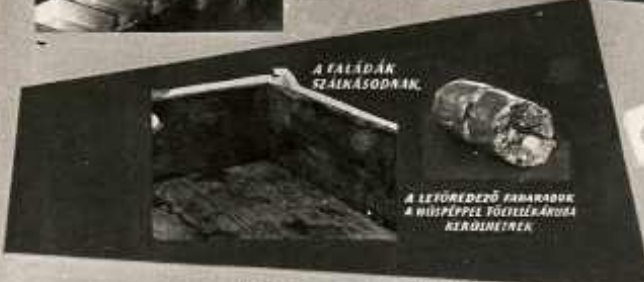
A FALÁDÁN SZELNÁSODNAK.