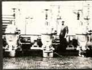
A KORSZERŰ ZSÍROLVASZTÓ ZÁRT RENDSZERBEN SZENNYEZŐDÉSMENTESEN TERMI