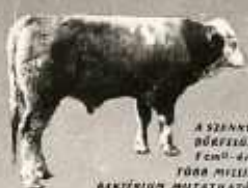
A SZENNYEK BŐRFEJTÉS ELŐTT FELDOLGÁSI TÁRSASÁG MUTATHATÓ RI