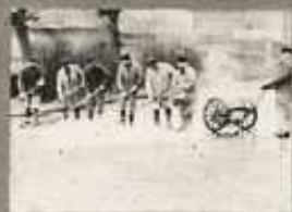
A VÁGÓNID KÖVEZETÉT MELLEK SZÓRÁS VIZSEL SZIRTALANÍTJUK ÉS NÉPEVEL FELMOSSUK