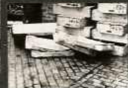
A SZARAPBAN EGYMÁSRA DOBÁLY LÁDÁN SZENNYEZŐDNEK