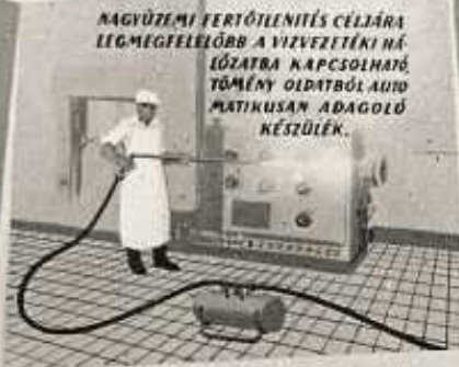
NAGYÜZEMI FERTŐTLENÍTÉS CÉLJÁRA LEGMEGFELELŐBB A VIZVEZETÉKI HÁ- LÓZATRA KAPCSOLHATÓ TÖMÉNY OLDATBÓL AUTÓ MATIKUSAN ADAGOLÓ KÉSZÜLÉK.