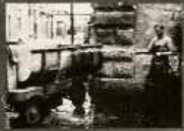
AZ ANYAGMOZGATÁSRA HASZNÁLT KÖCSKÁT