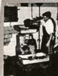
5-5%-ES CHLORAMINNAI VAGY % NITROGENIÁLL FERTŐTLENITJÜK.