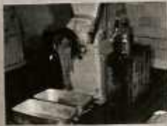
A FŐDRE HEVÉSZTET LÁDA FENNE SZENNYEZŐDIK, MAJD EGYMÁSRA TÉVE SZENNYEZI AZ ALAJTA LEVŐ LÁDA TARTALMÁT