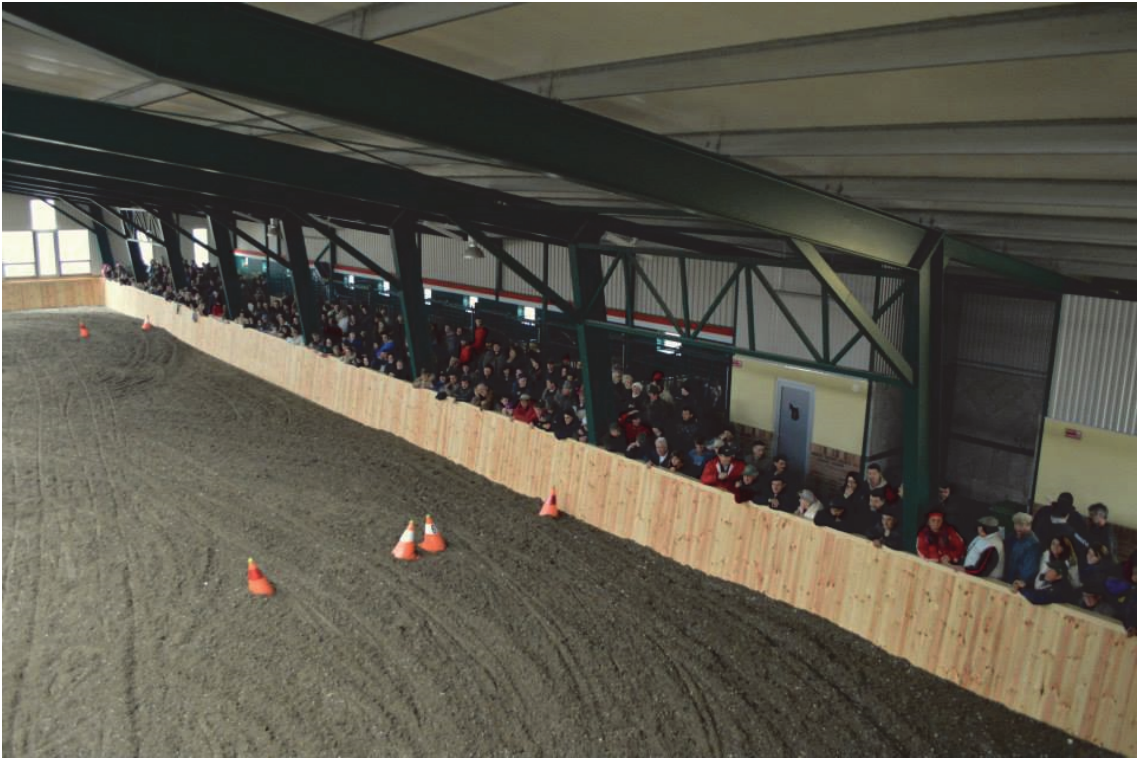
8. kép: fogathajtás tanulás