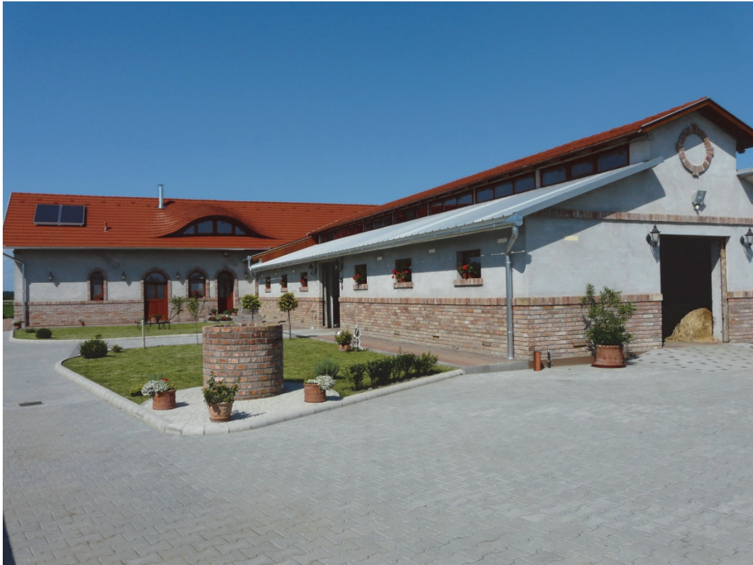
2 kép: Lovas bemutató