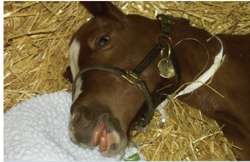
263. Idegrendszeri tünetek csikóban