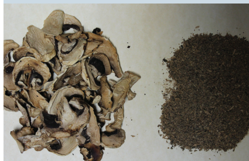
305. Száritott csiperkegomba

A folyóiratot indexeli és referálja/The journal is indexed and abstracted by: CAB Abstracts (CABI), Science Citation Index Expanded, Zoological Record, BIOSIS previews (Thomson Reuters), Scopus (Elsevier). Tartalom/Contents: Current Contents – Agriculture, Biology & Environmental Sciences (Thomson Reuters)