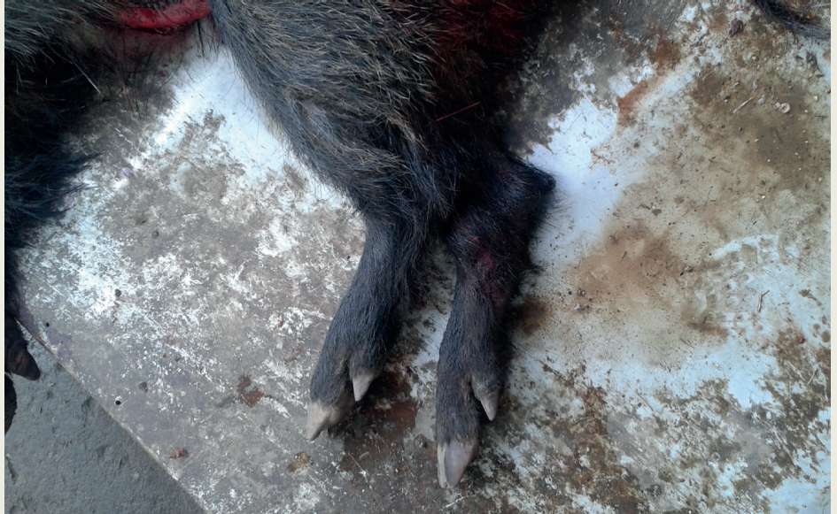
FIGURE 5. Unmarked shot wild boar

sági kockázat miatt az élelmiszerlánc-biztonsági hatóság határozatban tiltotta meg a 60 kg jelöletlen, nyomonkövethetetlen szarvashús forgalomba hozatalát és a megsemmisítését rendelte el, valamint élelmiszerlánc-felügyeleti bírság is kiszabásra került. Mivel az elkövető és az orvvadászati cselekmény tettenérése ebben az esetben nem történt meg, a bűncselekményre közvetlen bizonyíték nem állt rendelkezésre, így büntetőjogi eljárás nem indult. A területileg illetékes vadászati hatóság az eljárásról tájékoztatást kapott, amely alapján eljárást indítottak a hűtőkamra üzemeltetője ellen. Ennek eredményeként vadvédelmi bírságot szabtak ki és az elkövetőt fél évre eltiltották a vadásztól.