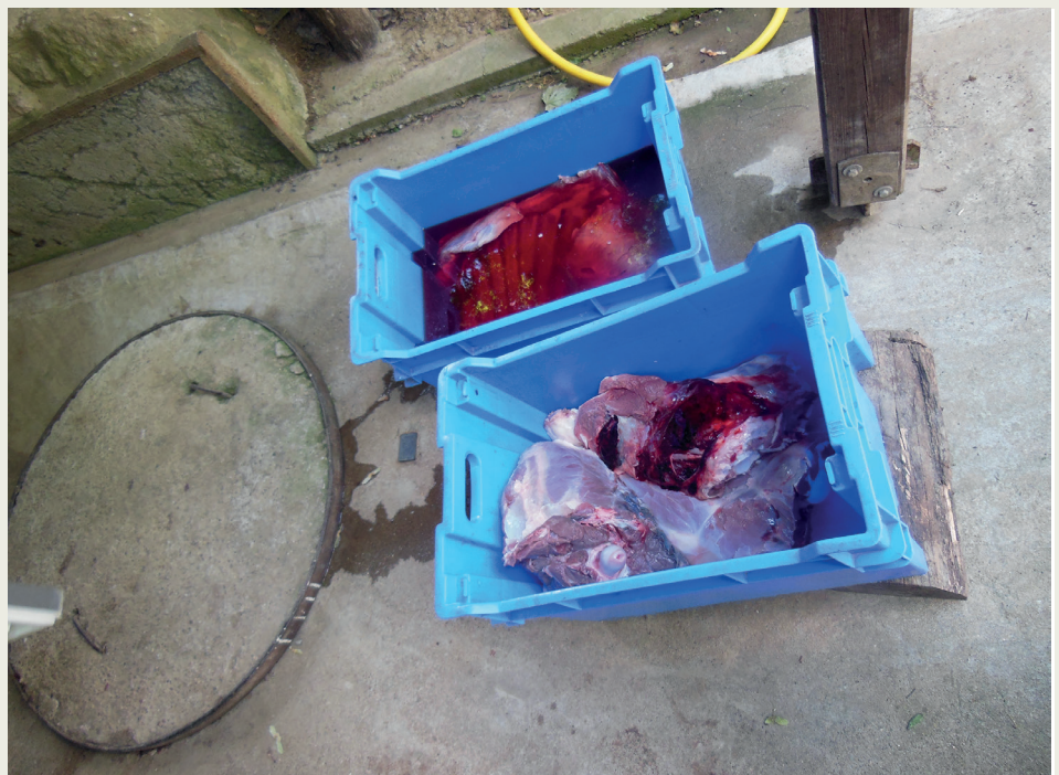
FIGURE 2. Processing of illegally shot deer