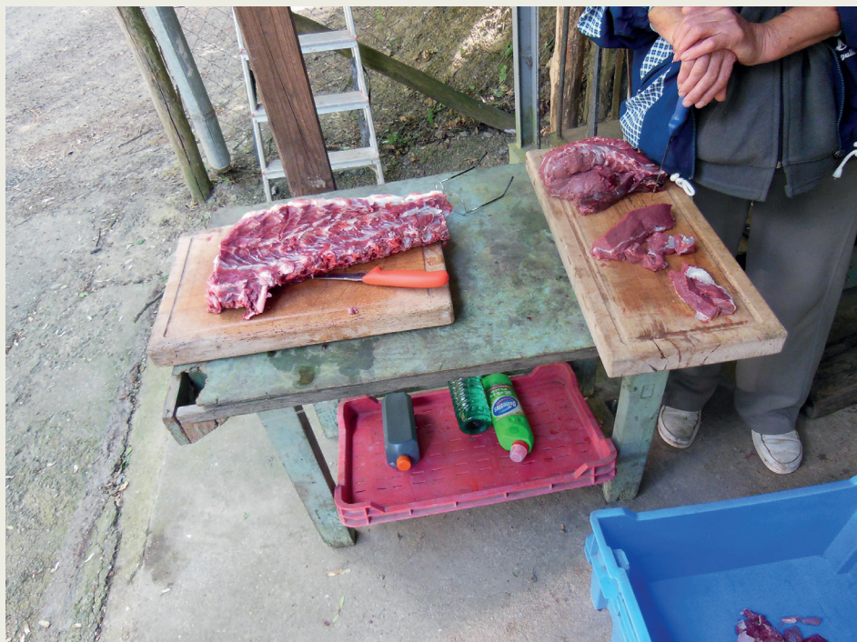
FIGURE 3. Processing of illegally shot deer – chopping

4. ÁBRA. Fogyasztásra előkészített illegális vadhús