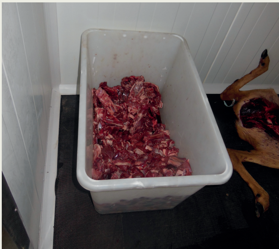
FIGURE 4. Illegal game meat prepared for consumption

vadkísérő jegyet és a húsvizsgálati igazolást bemutatni nem tudtak. A vadbe-gyűjtő helyet üzemeltető nyilatkozta szerint a szarvast a helyi vadásztársasá-gtól kapták falunapra. Mivel a vad nyomkövethetősége nem volt biztosított, az eredete ismeretlen volt. A húsvizsgálatot hatósági állatorvossal és más erre jogosult személlyel nem végeztették el. A fennálló súlyos élelmiszerlánc-bizton-