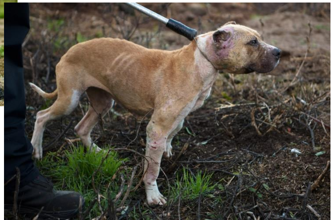
3. ábra Kutyaviadalról elkobzott állat [26]

Figure 2 Two dogs trained for fights during fighting [25]