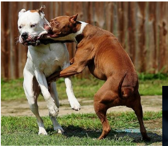
2. ábra Két viadalra trenírozott kutya harc közben [25]

Szerzők és művészek alkotásaiból kiderül, hogy a kutyaviadatok Angliában a 18. század elején voltak népszerűek, később viszont a bull-baiting (kutya bikával való viaskodása) és a bear-baiting (kutya medvével való viaskodása). A 19. században jöttek ismét divatba a kutyaviadatok állandó programként szervezett rendezvényei ( 2. ábra ). Ekkor történt, hogy a bulldogba terrier vért kevertek a tenyésztés során. A bulldogtól örökölt küzdeni akarás és fájdalom iránti alacsony érzékenység kombinálva a terriertől örökölt gyorsasággal, mozgékonyssággal és atletikussággal már igazán hatékonynak bizonyult. A 3. ábrán látható az ilyen célzattal kialakított kutya jellegzetes felépítése [24].