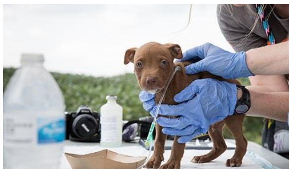
6. ábra A fiziológiai állapot visszaállítása érdekében rehidrálják a kölyök kutyát [43]

5. FBI: „A Federal Bureau of Investigation, azaz a Szövetségi Nyomozó Iroda az Amerikai Egyesült Államok szövetségi szintű nyomozószerve.” 2016 januárjában az FBI elkezdte nyomon követni az állatok ellen elkövetett bűncselekményeket, mely nyomán a 2017-es National Incident-Based Reporting System (NIBRS) jelentések azt mutatják, hogy az adatgyűjtés első évében több mint 3200 állatkínzási eseményt jelentettek [44].