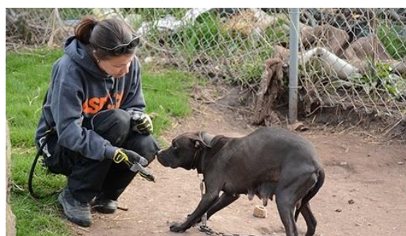
7. ábra A bizalmatlan és testtartásában félelmet mutató állathoz való emberi közeledés látható, melyet a tanyáról való elszállítás követ [43]

Figure 6 In order to restore the physiological state, the puppy is being rehydrated[43]