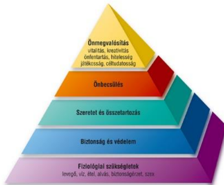
1. ábra Maslow piramis a jólléthez szükséges alapvető szükségletekről[23]

Abraham Maslow által felállított hierarchikus teória a jólléthez szükséges alapszükségletek és motivációk egymásra épülésének megközelítése ( 1. ábra ) [23].