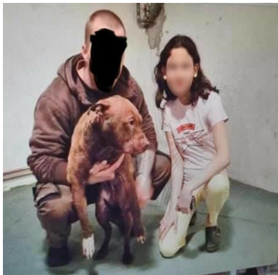
4. ábra Viadal kutyákkal üzletelő férfi és egy kiskorú lány, aki fiatalon tapasztalja a meccsek látványát és a kutyák tartásának módját [27]