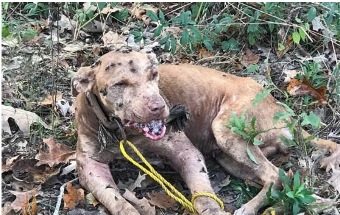
5. ábra Rossz kondícióban lévő viadaloztatott kutya [50]

A megelőző egészségügyi ellátás hiánya miatt nagy a fertőző betegségek terjedésének lehetősége. Az Egyesült Államokban végzett nyomozás alapján a leggyakoribb