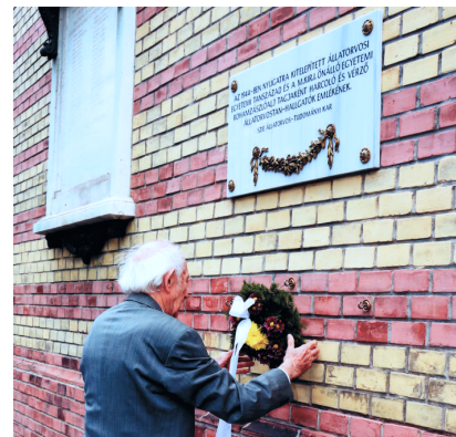
Az 1944-ben nyugatra telepített Egyetemi Tanzászlóalj és a M. Kir. I. Önálló Egyetemi Rohamsászlóalj tagjaként Budán harcoló és vérző állatorvostan hallgatók, valamint az I. világháborúban elesett állatorvosok és állatorvostan hallgatók emléktábláinál

Jártuk a lövészárkokat, a lövészárkokat, a bunkereket. Az egyik félelmetes műzeumban az elesett magyar katonahősök tablóképe előtt egy 17 éves diák, a budai Szent Imre Gimnáziumból, így szólt: „eleinte kerültem a katonák tekintetét. Ugyan nem féltem tőlük, de valami nehezen magyarázható szégyenérzet is volt bennem, ha könyvekben, újságokban, a televízióban a hősi halott katonák arcát láttam. Nem tudom, hogy miért, de most már bele tudok nézni a szemükbe. Mintha bárátkoznék velük, mintha közeli vagy