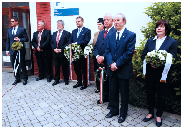
Az 1939 és 1956 között hősi halált halt állatorvosok és állatorvostan-hallgatók nevét megörökítő dombormű koszorúzó

A második világháborút követően, 1945-ben a korábbi nagyhatalmi