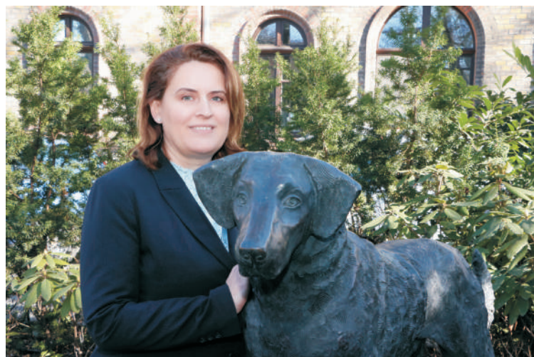
A gyerekkori kedvenc kutyafajta, a kuvasz szobrával