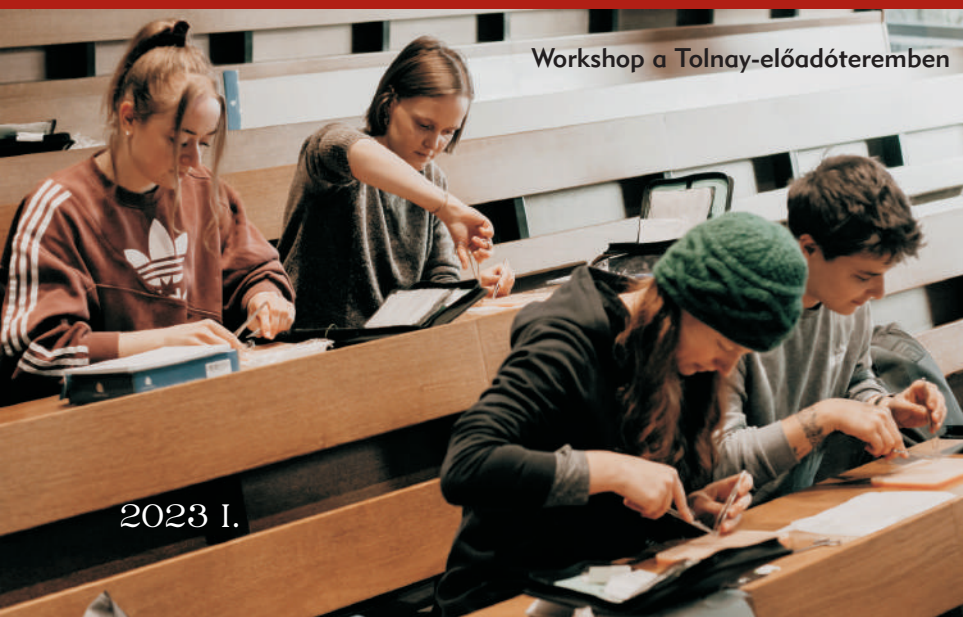
Workshop a Tolnay-előadóteremben