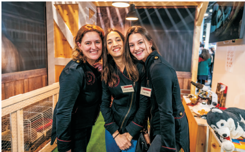
"I also get a lot of help from students implementing the Educatio exhibition"

– When did you leave the Váli Valley for a longer time?