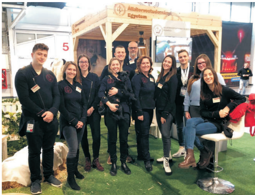
Mindig kell egy csapat – ez érvényes az Educatio Nemzetközi Felsőoktatási Kiállításra is

Csodálatosnak tartom, hogy állatorvostan hallgatóként tanáraikkal