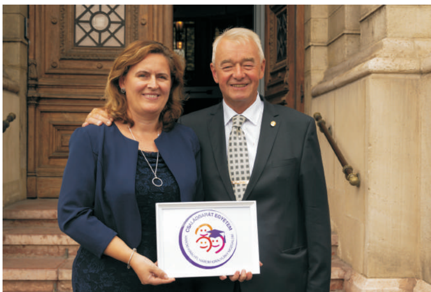
A Családbarát Egyetem oklevelet az Akadémián adták át

A Marek József ösztöndíj alapítása rávilágított, hogy egyetemünk képzési kínálatát minél jobban meg kell ismertetnünk az érdeklődőkkel, ezért tavaly ősszel az összes középiskolát levélben tájékoztattuk arról, hogy szívesen veszünk részt a pályaorientációs napjukon. Nagy volt az érdeklődés, így több, mint 40 gimnáziumba látogattunk el kollégáimmal, ahol előadásokat tartottunk Egyetemünkről és szakjainkról. Sajnos még mindig az a tapasztalat, hogy sokan nem tudják, hogy Magyarországon önálló Állatorvostudományi Egyetem létezik, amely