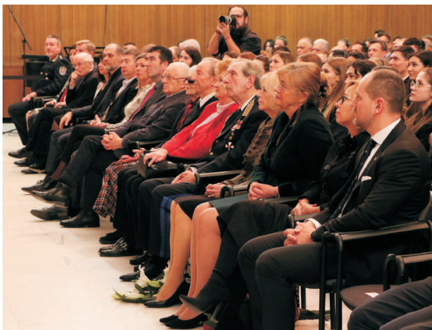
Kitüntettek, vendégek és egyetemi vezetők az intézmény legfontosabb ünnepségén

„Eddigi életem legvidámabb, legizgalmasabb és legelkeseredettebb perceit köszönhetem az egyetemi tanulmányaimnak. Bizton állíthatom, hogy ha nincs egy összetartó közösség, motiváló tanárok és jövőkép, akkor feladtam volna.