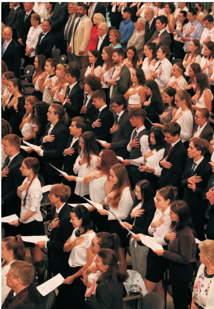
Az elsők hallgatók eskütétele