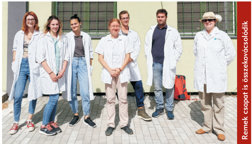
Remek csapat is összekovácsozódnak

DB: – Az évfolyam-képviselőnkön keresztül jutott el hozzám az információ a nyári egyetemről, amin a harmad- és negyedévesek vehetnek részt. Elolvastam a hirdetést és jelent-