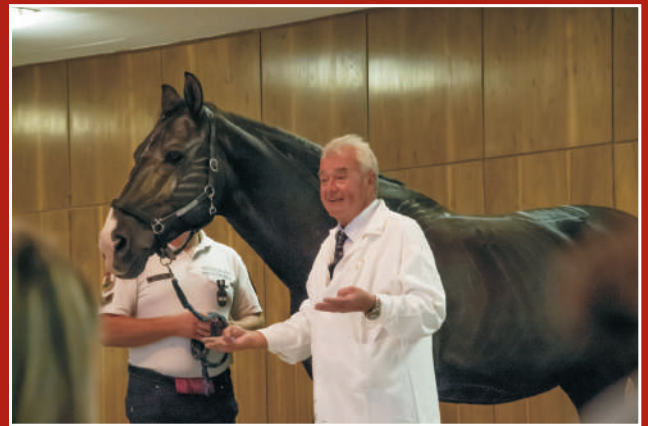
Herczeg Dóra képriportja