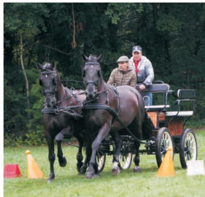
Éremeső a tatai sportnapon 23