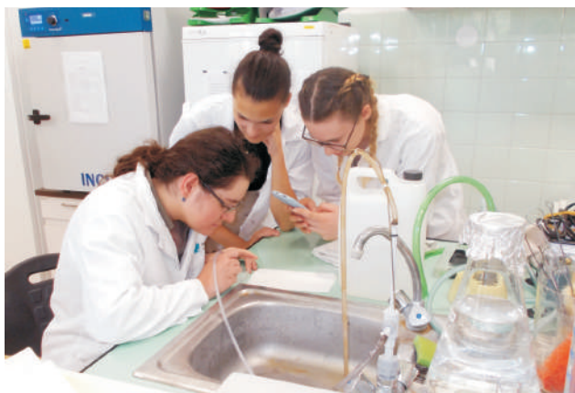
Harmad- és negyedéveseket vártak, várnak

DB: – Ami nekem nagyon tetszett, hogy mi végezhattük el a mintavételt, csinálhattunk kenetet, amit aztán mi festettünk meg, megvizsgáltuk, majd meg is tarthattuk. A doktornő hozott tényleges esetekből származó keneteket is, ezeknél közösen megbeszéltük, hogy mit látunk rajta. Szuper volt, hogy a doktornő hagyott minket gondolkodni, nem volt rossz válasz és nagyon érthetően magyarázott. Nekem ez volt a kedvenc programom. Vasárnap a radiológiai központban lévő CT és MR berendezésekkel ismerkedtünk az ott dolgozók segítségével, itt szintén valós esetekkel foglalkoztunk. A lókorház technikai háttérét is megnéztük, a CT-t, az endoszkópos