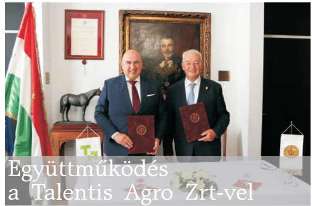
Együttműködés a Talentis Agro Zrt-vel

A vezérigazgató felajánlotta a zrt. állattartó telepeit a diákok gyakorlat-szerzésére. Az Egyetemről olyan, az