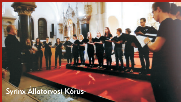
Syrinx Állatorvosai Kórus