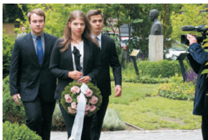
A hallgatói önkormányzat képviselői is elhelyezték virágjaikat

Én azt mondom, hazánkunk rendületlenül. Éljen Magyarország!