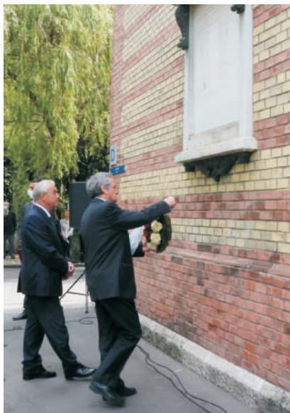
Koszorúzás a könyvtár falán elhelyezett emléktáblánál