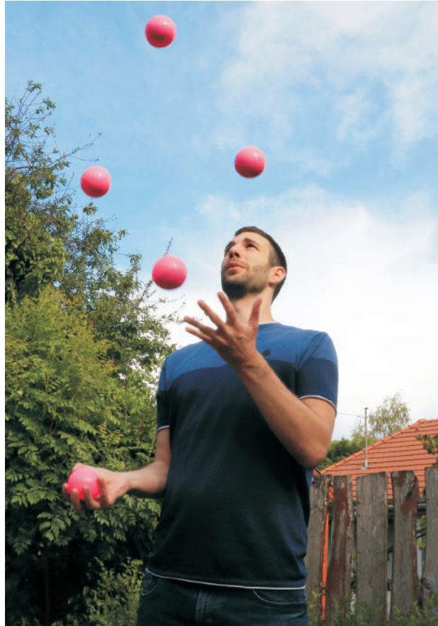
Five ball cascade in the air

directions as well. I want to be a practising vet who also publishes. I'm glad that they've listened to my opinion several times when it came to reptile care.