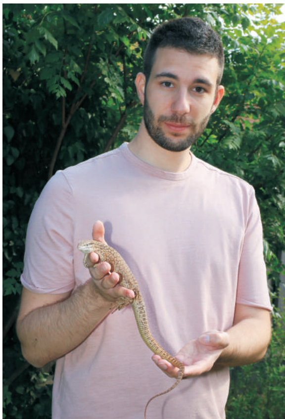
Tüskésfarkú varánusz ( Varanus acanthurus ) kihelyezése szabadtéri terráriumába

– Hallgatókként hogyan tartottátok egymással a kapcsolatot?