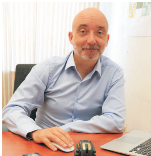
"Mi kezdtük a sort a tárca összefoglalójában"

– Ha egy oktató videót nagyon jó, akár 4K minőségben szeretnénk feltölteni, a nagy méretű fájl sok tárhe-