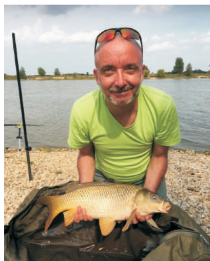
"Kedvencem a sporthorgászat"

– Az a szerencsém, hogy az egyetemi feladataim a hobbimnak is tekinthetők. Apám 12 évesen engem hurcolt az ismerőseihez, hogy a rendszerváltáskor megnyíló határokon behozott elektronikai eszközöket beállítsam. Az informatikában nem lehet kényelmesen hátra dőlni, mondván, én most már mindent tudok. Ráadásul ezen az egyetemen megtiszteltetés dolgozni. Ez az intézmény egyszerre családias és