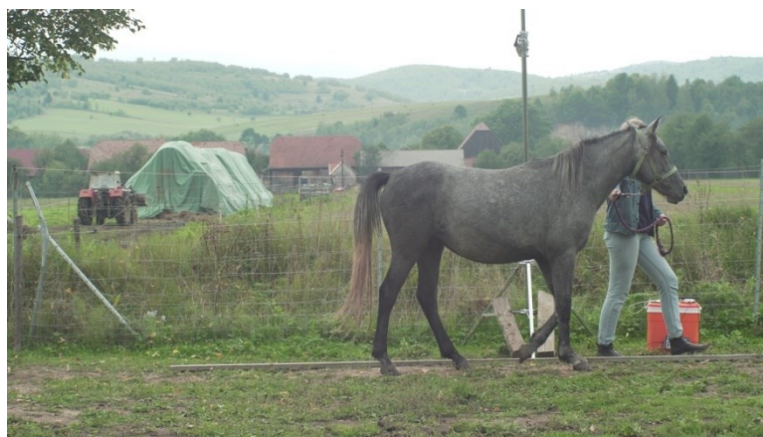
3.kép: 2022-es szemle aranyérmese fiatal kanca kategóriában

-Rendkívül fontosak a száraz ízületek, lábtő, csánk, és a bokaszőrök hiánya.