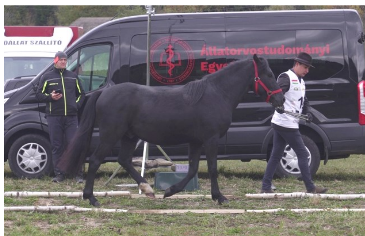
1. kép: 2021-es Szemle aranyérmese Junior mén kategóriában: Csasszán

2021 végére már 70 volt a törzskönyvezett lovak száma. Ebben az időpontba kezdtük meg mi is a méréseinket a VATEM rendszer segítségével a mustra alatt (1. kép).