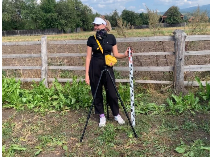
2.kép: videófelvétel készítés oldalnézetben a VATEM méréséhez

2023. szeptember 13-17: 14.-én kezdtük meg a méréseket újfent MEREKLYE egyesület lovaival kezdve, ezután ismét, mint előző évben zabolai lovak következtek majd másnap 15.-én Csíkszentsimonban mértünk. Az idei év mérései mellé meg a vérvételek társultak, ami meghosszabbította a munkánkat.