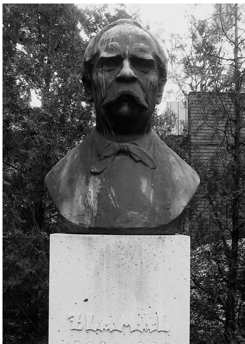
ZLAMÁL VILMOS MELLSZOBRA AZ EGYETEM PARKJÁBAN (MADARASSY WALTER ALKOTÁSA)

és hivatalnok kötelességtudó és pontos volt; tanítványai előtt atyai, jó bánásmóddal szerzett magának rokonszenvet és tiszteletet.